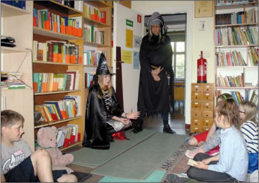
Fot. z archiwum biblioteki

wiązanie jednego zadania kierowało do kolejnego. Ostatnie zadanie (tajemna mapa) wskazało miejsce ukrytej w ziemi skrzyni z najcenniejszym skarbem, jakim są książki. Pełen wrażeń wieczór zakończył się wspólnym posiłkiem oraz wspólnym oglądaniem filmu na wcześniej przygotowanych posłaniach.