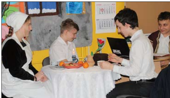
Scena w domu Boba