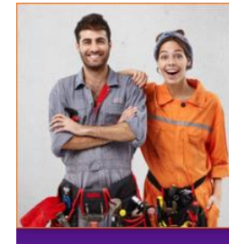
Instalacje sanitarne i grzewcze