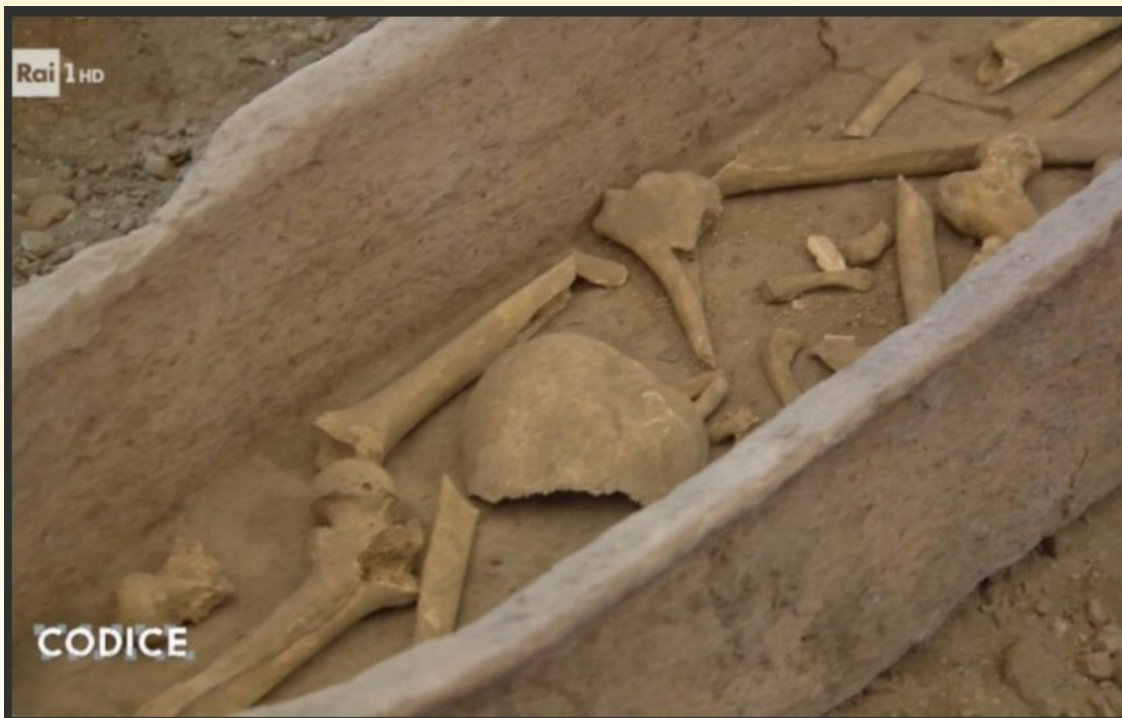
Kości św. Piotra